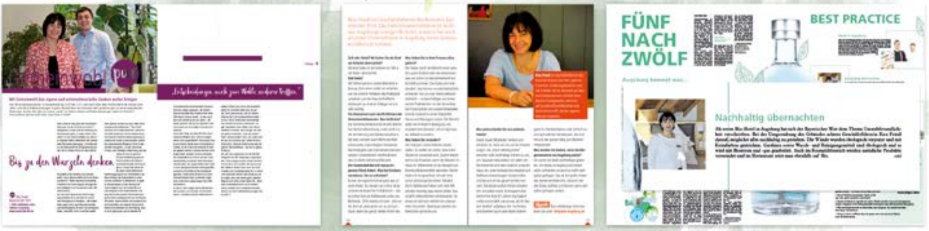
... Purpur ... lifeguide ... Panorama Nachhaltigkeit